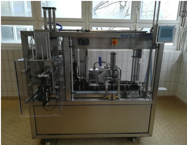
Giebelkarton-Verpackungsanlage für flüssige Milcherzeugnisse